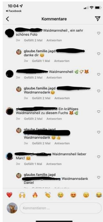
Bilder und Kommentare eines offenen Konto bei Instagram

Anlage zum Offenen Brief: Fakten zur Fuchsjagd